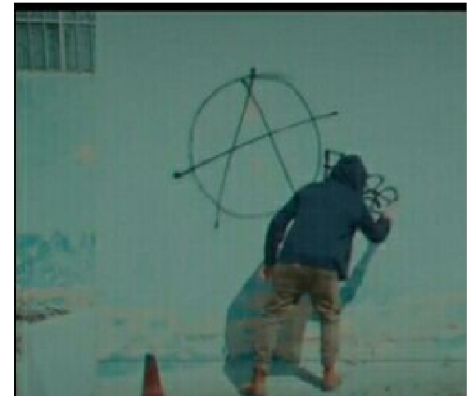
tags anarchistes à Shiraz en Iran