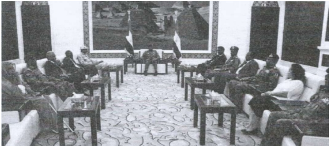
Membres du Conseil Souverain du Soudan, lors de leur première réunion en Août 2019

Le Conseil Souverain du Soudan est une entité composée de 11 membres et a été créée après le renversement de Bashir, à partir d'une ébauche de constitution en Août 2019 dans la ville de Djouba, au Sud Soudan. Ce conseil était constitué de membres d'un groupe civil appelé Forces for Freedom and Change (FFC – Forces pour la liberté et le changement) et des dirigeants du conseil militaire de transition (Transitional Military Council (TMC) pour former une entité collective qui devait prendre le contrôle de l'État jusqu'en Novembre. Au lieu de cela, le conseil fut dissout avec le coup d'état du 25 Octobre. Le président du conseil Abdel Fattah al-Burhan a annoncé sa dissolution et son remplacement par un gouvernement prochainement nommé.